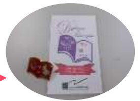
博士認定証とピンバッジ