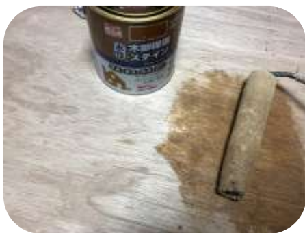
↑ 研磨作業後、木部保護塗料塗布