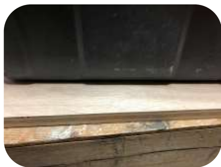
↑ 耐水ベニヤ2枚貼り接着

プラ舟も砂の重みで変形していたのでプラ舟の下にアルミの棧を作り、砂の重みを受けるよう設計しました。